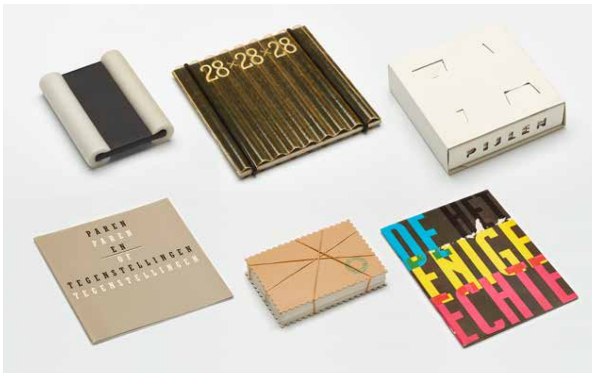
Publicaties Academie St Joost, afdeling Grafische Vormgeving, 1986-1997