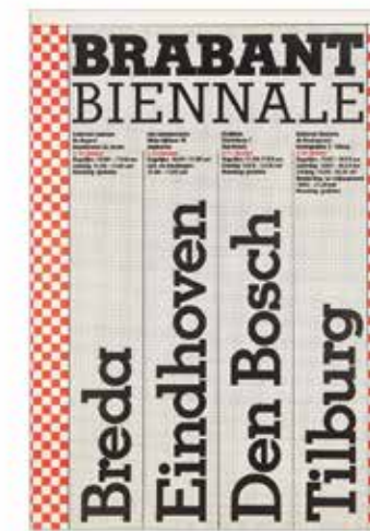
Poster Brabant Biennale, 1976