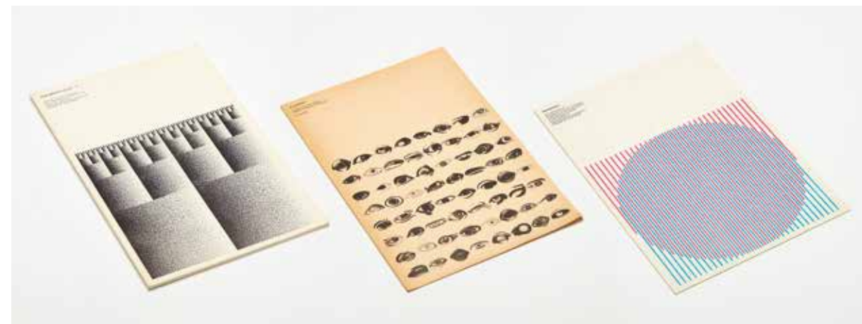
Vormstudies St Joost, links nr 7 1971, midden nr 8 1973-1974, rechts nr 9 1974-1975