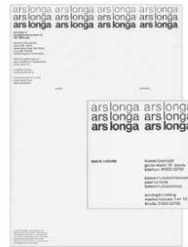
Huisstijl ars longa, 1973 - 1976