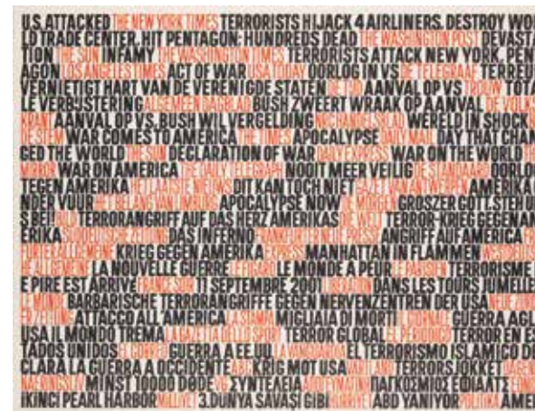
Vrij werk, 2001