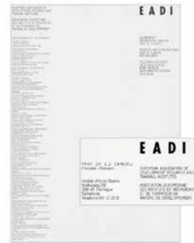
Huisstijl EADI, 1979